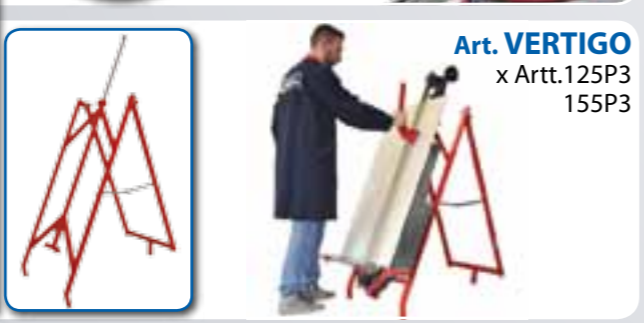
Art. VERTIGO x Artt. 125P3 155P3

GARANZIA - Tutte le tagliapiastrelle manuali MONTOLIT sono coperte da garanzia a vita (riconosciuta a giudizio esclusivo dell'Ufficio Tecnico della Brevetti MONTOLIT S.p.A.) su eventuali difetti di costruzione. Guasti derivanti da un uso non conforme o da normale usura sono esclusi dalla presente garanzia.