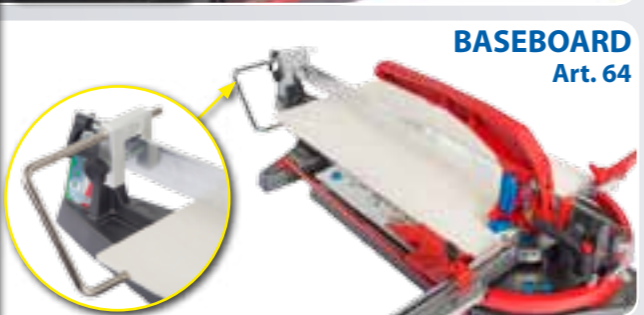
BASEBOARD Art. 64