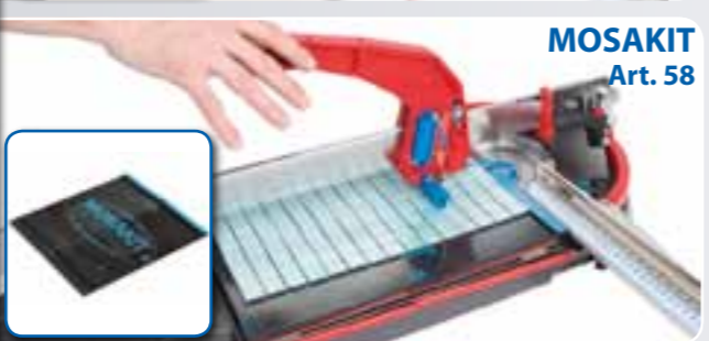
MOSAKIT Art. 58