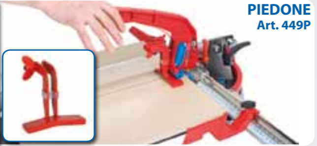
PIEDONE Art. 449P

ACCESSORI • ACCESSORIES • ACCESSORI • ACCESSORIES • ACCESSORI • ACCESSORIES • ACCESSORI • ACCESSORIES • ACCESSORI • ACCESSORIES